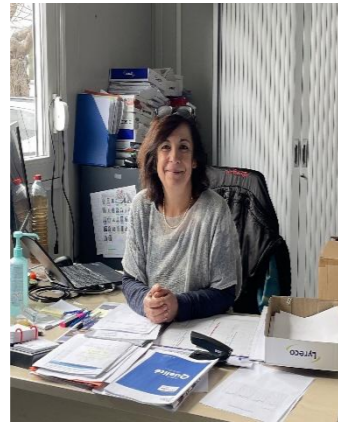
FORMATRICE RESPONSABLE IFAS