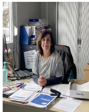
FORMATRICE RESPONSABLE IFAS